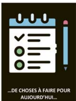
...DE CHOSES À FAIRE POUR AUJOURD'HUI...