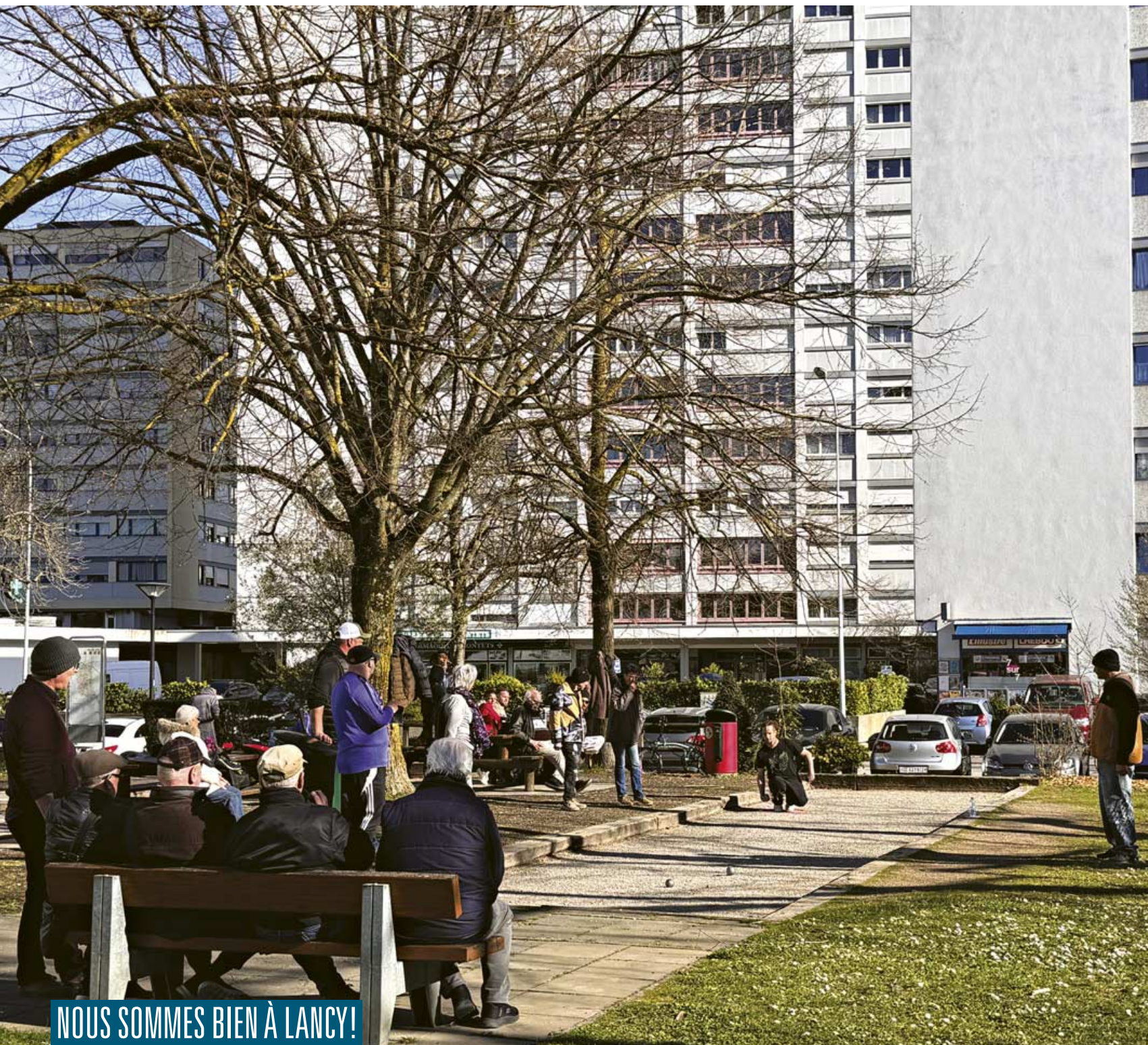
Pétanque du Parc, association de La Prairie