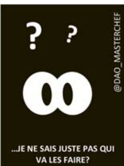
...JE NE SAIS JUSTE PAS QUI VA LES FAIRE?