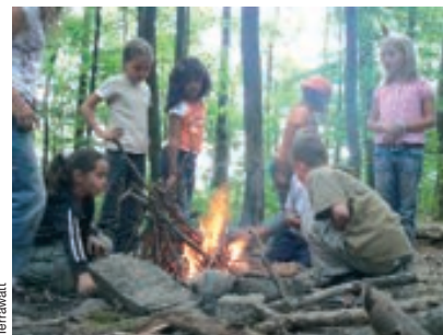
La conquête du feu.

Nous avons appris à être plus économiques que d'habitude: éteindre les lumières quand on sort d'une pièce, fermer le robinet d'eau quand on se lave les dents, éteindre une rangée de lumières dans la classe quand il y a beaucoup de soleil, éteindre l'ordinateur et ne plus le laisser en veille. Nous avons trouvé que ce travail était très intéressant surtout en ce moment vu qu'il y a le réchauffement de la planète et les problèmes de pétrole. ☺ Texte rédigé par les élèves de 3-4-5 et 6P de l'école Cérésolo