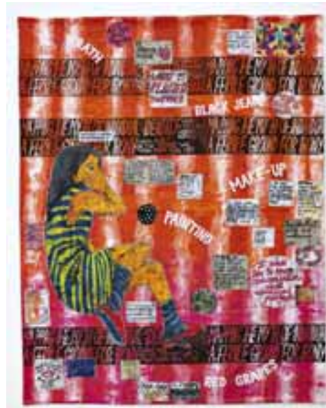
Laure Marville, Moodboard 3, linogravure et broderie sur textile, 156 x 123 cm, 2019