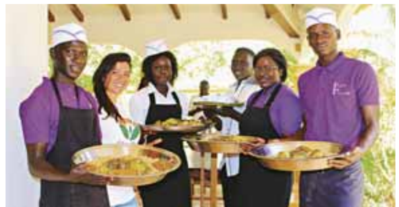
Echanges entre les clients et les apprenants autour des mets locaux-Tourism for Help

Découvrez le film sur notre projet au Sénégal: https://youtu.be/H8KMYPDo6G8 www.tourismforhelp.com 7, Vieux-Chemin-d'Onex 1213 Petit-Lancy T 077 403 25 90