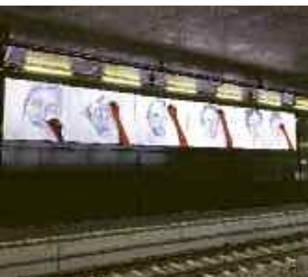
Phoebe Boswell, PLATFORM, 2019 à la gare Lancy-Bachet