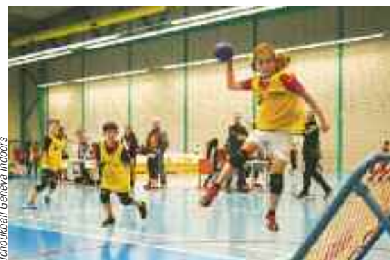
Tchoukball Geneva Inboars

C'EST BIEN CONNU, PRATIQUER UN SPORT EST bon pour la santé. C'est un facteur important pour notre hygiène de vie et pour rester en forme. Aussi, afin d'inciter la population à pratiquer une activité physique régulière, la Ville de Lancy organise chaque année une semaine dédiée au sport.