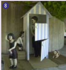
8 Vues sur la mère , 1999 Clarence Stiernet