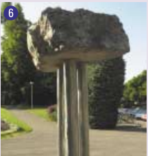
6 Dol Men , 1985 Jo Fontaine