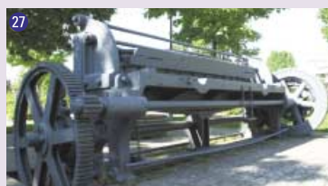
27 Presse (avenue Louis-Bertrand)