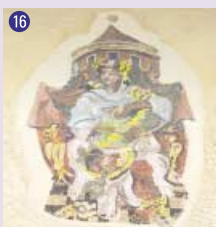
16 Mosaïque , 1971 E. Beretta