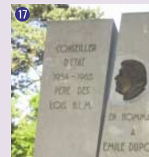
17 Mémorial Emile Dupont , 1998 Vincent Du Bois & Pierre Buchs