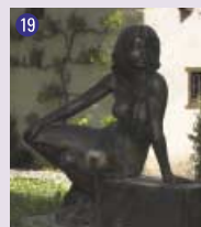
19 Femme assise , 1989 Alexandre Meylan