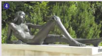
4 Jeune fille étendue , 1988 Heinz Schwarz