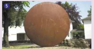
5 Fruit urbain , 1999 Vincent Du Bois