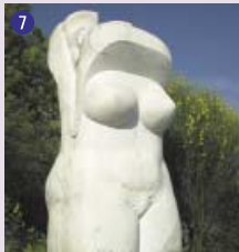
7 Croque Soleil , 1990 Daniel Polliand