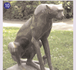
10 Guépard , 1983 Marc Fornasari