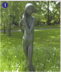
1 Jeune fille , 1975 Heinz Schwarz