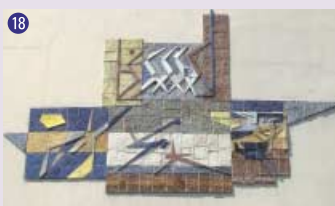
18 Bloc figuratif , M. Noverraz & E. Beretta