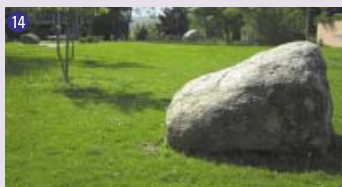
14 Les sept cailloux du Petit Poucet , 1995 Dominique Fontana