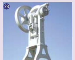
28 Cisaille Kuckeris (avenue Louis-Bertrand)