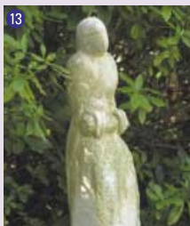
13 Perroquet , 1984 Arie (Gerit) Den Hartog