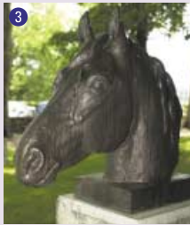
3 Tête de cheval , s.d. Frédéric Schmid