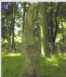
12 La Danseuse , 1985 Marcel Wille