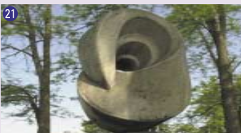
21 Coquillage , 1965, Marcel Wille