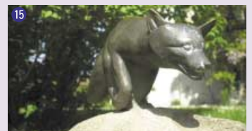
15 Renard , 1983 Rober Hainard