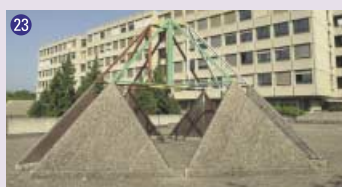
23 Toitures-terrasses , 1977, Serge Candolfi