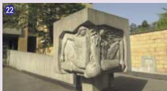
22 Reliefs en béton , 1968, Daniel Polliand