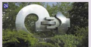
24 Volute , 1975, Manuel Torres