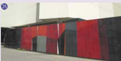
25 Œuvre murale , 1965, Jean Baier