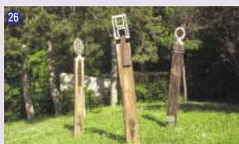
26 Sans titre , 1997, Mireille Fulpius