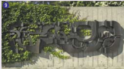
9 Relief en bronze , 1976 Alain Schaller