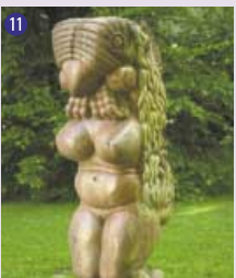
11 Cérés à tête d'oiseau , 1979 Daniel Polliand