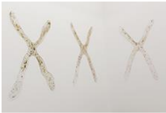
Vanessa Billy, Chromosomes, 2017.