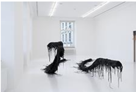
Vanessa Billy, Centipedes, 2019