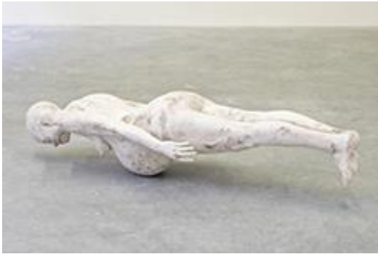
Vanessa Billy, Centuries, 2016, collection de l'office fédéral de la culture, Berne