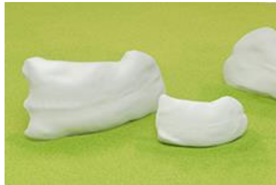
Vanessa Billy, Coquilles, 2019