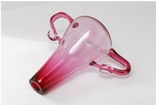
Vanessa Billy, Utero, 2019.