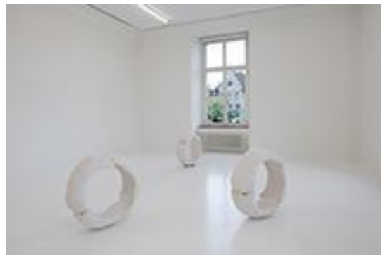
Vanessa Billy, Ouroboros, 2020